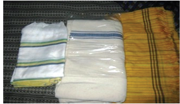
لوحة (١-ج) بعض أنواع المنسوجات