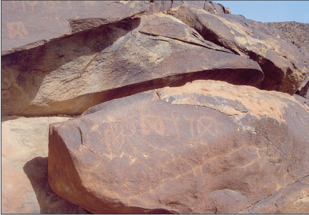
اللوحة (١١) نقش ٩