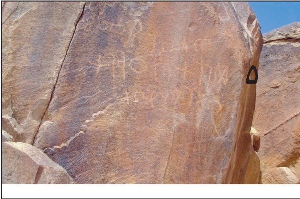
اللوحة (١١) نقش ٥