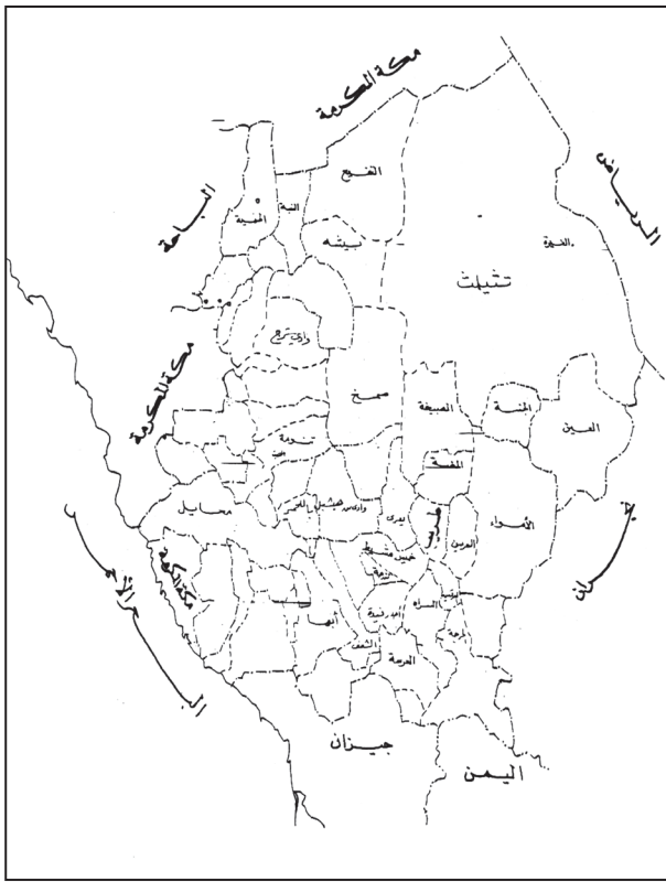
خارطة توضح موقع محافظة طريب