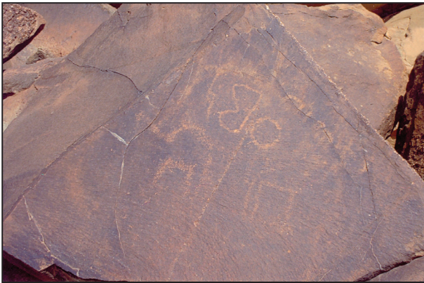
اللوحة (٧) نقش ١

الدراسة: كُتِبَ هذا النص من اليمين إلى الشمال بواسطة النقر.