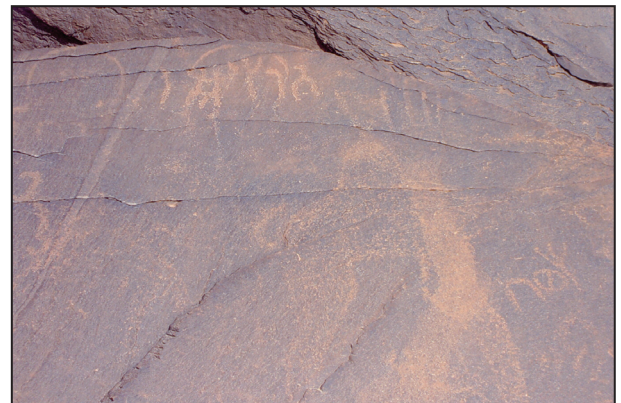
اللوحة (٩) نقش ٣

م س ع د: اسم علم بسيط على وزن مفاعل وفي اللغة: سعد تعني السعيد (ابن منظور ١٩٥٥، ج ٣: ٢١٣)، ورد بصيغته هذه في النقوش الثمودية (أسكوبي ١٤٢٠: ٦٤)، وفي النقوش الصفوية (الذبيب ١٤٢٤: 45 Harding 1971: 544)، بينما جاء بصيغة م س ع د م في النقوش السبئية (العززي ١٤٢٤: ١٤١)، وفي النقوش القتبانية