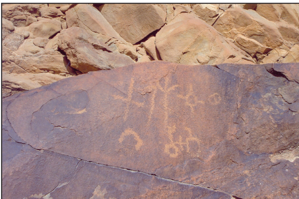
اللوحة (٨) نقش ٢