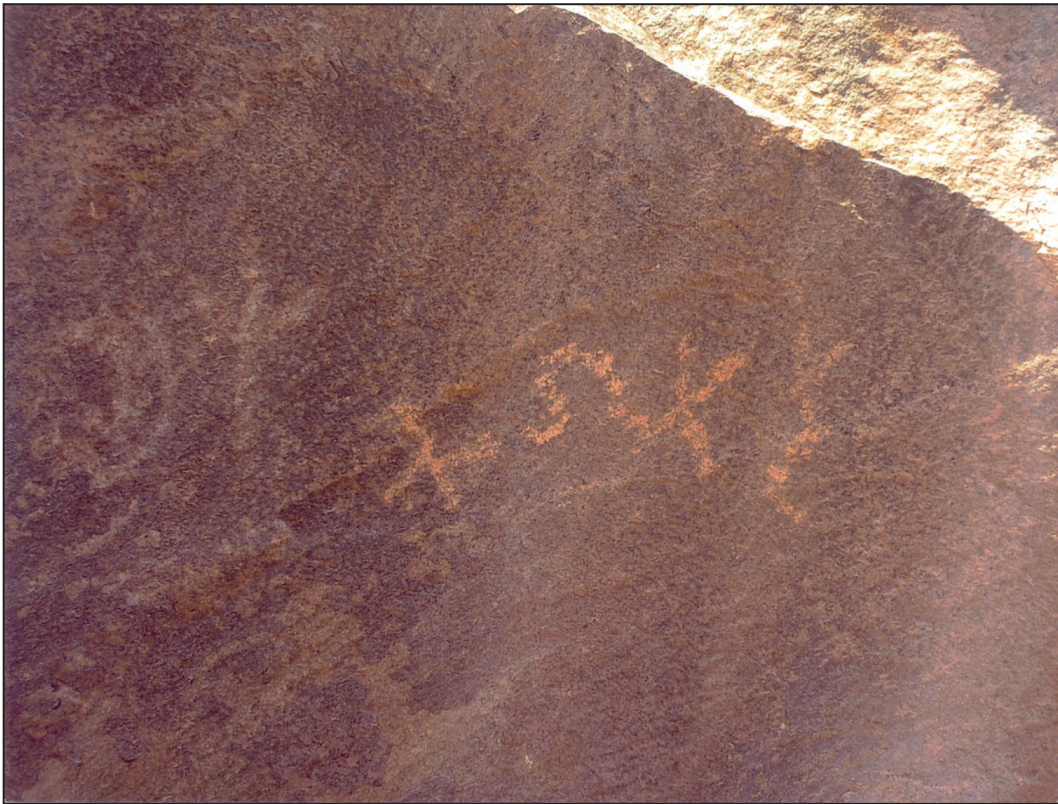
اللوحة (١٢) نقش ١٠