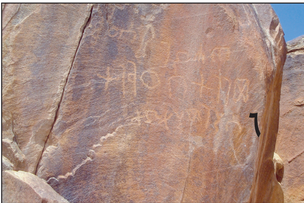
اللوحة (١٢) نقش ٦