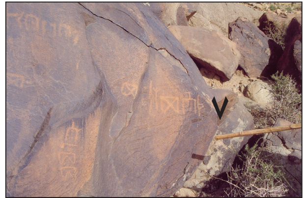
اللوحة (٩) نقش ٧

ه خ ف ت: اسم علم بسيط على وزن هفعل يتكون من أداة التعريف الهاء، وخ ف ت وفي اللغة: خ ف من الخفف وهو الجمل المسن، ويطلق أيضاً الخفوف على الضبع (ابن منظور ١٩٥٥، ج ٩: ٨١). ورد بصيغة خ ف ت في النقوش الصفوية (Harding 1971: 224)، تجدر الإشارة إلى وجود أعلام شبيهة تبدأ بأداة التعريف الهاء جاءت في النقوش التمودية (أسكوبي ١٤٢٨: ٤٨١؛ السعيد ١٤٢٤: ١٠٢)، وفي النقوش الصفوية (الذبيب ١٤٢٤: ٣٦)، وفي النقوش اللحيانية (أبو الحسن ١٤٢٣: ٢٣٨).