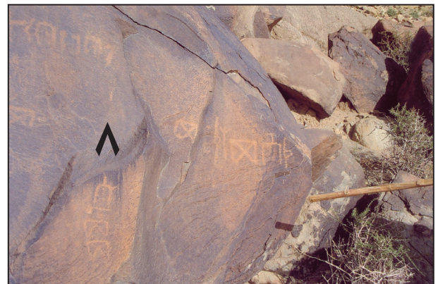
اللوحة (١٠) نقش ٨