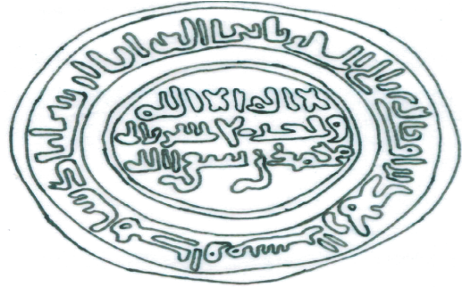
الشكل ١: رسم توضيحي لكتابات الدينار في اللوحة ١ .