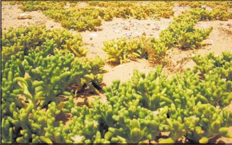
السمح: نبات بري تتميز به براري منطقة الجوف