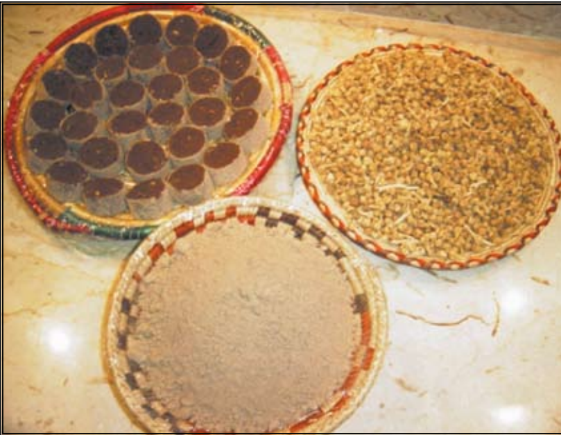
تستخرج من نبات السمع حبوب تطحن وتخلط مع التمر فينتج منها (البكيل)